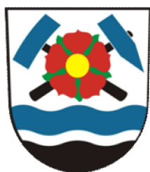
ČERNÁ V POŠUMAVÍ